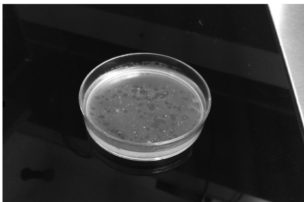
Рис. 1. Зоны лизиса (плаки) на поверхности роста культуры M. smegmatis для подсчета активности вирусных частиц препарата микобактериофага.

вых плотных средах, для этого требуется дополнительно 3—4 недели. Врач получает результаты исследования чувствительности возбудителя к лекарственным препаратам не ранее чем через 1,5 мес от начала лечения, что при неоптимальном выборе препаратов существенно снижает эффективность и удлиняет сроки лечения пациентов. Врачу необходимы данные о чувствительности сразу широкого спектра препаратов, поскольку некоторые препараты могут характеризоваться плохой переносимостью.